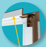
Ailette de recouvrement amovible pour réglage